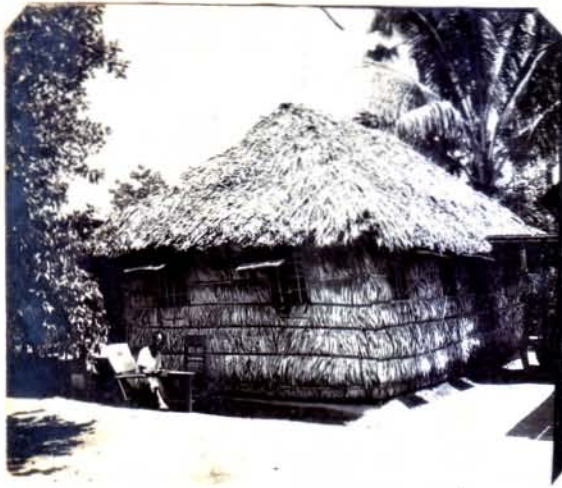
အည်လီကော့၊ ဦးခင်မောင်၏အိမ်။ အနီးကမ်းရှိ-ကျောင်း ဝင်း၊ ချန်တကျ အုပ်စုကွဲ ချက်ချင်း ချိတ်လျှော့ခြင်းကြောင့် ဖြစ်ပုံ။