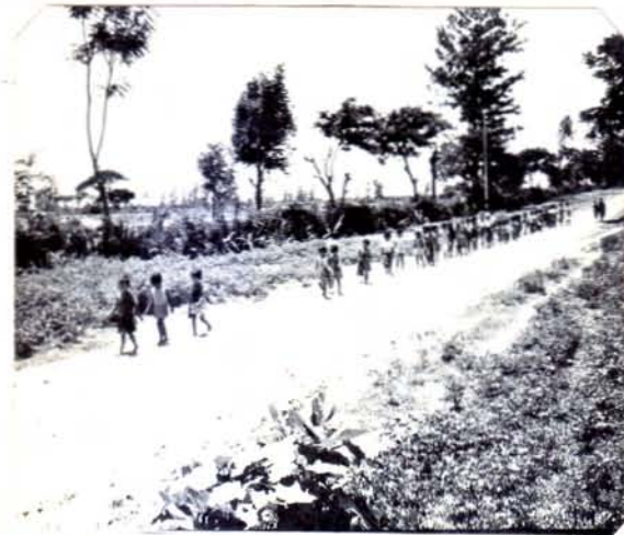
အည်လီကော့၊ ချန်တကျ ချိတ်လျှော့ခြင်းကြောင့် ဝင်း၊ ချန်တကျ အုပ်စုကွဲ ချက်ချင်း ချိတ်လျှော့ခြင်းကြောင့် ဝင်း၊ ချန်တကျ အုပ်စုကွဲ ချက်ချင်း ချိတ်လျှော့ခြင်းကြောင့် ဖြစ်ပုံ။