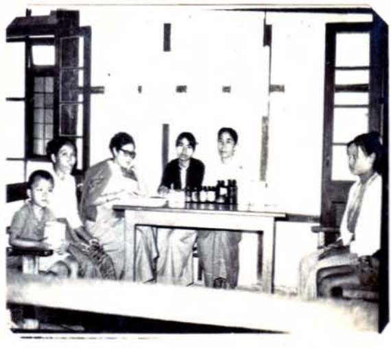
အည်လီကော့၊ အချင်းချင်း၊ ချန်တကျ ချိတ်လျှော့ခြင်းကြောင့် ဝင်း၊ ချန်တကျ အုပ်စုကွဲ ချက်ချင်း ချိတ်လျှော့ခြင်းကြောင့် ဖြစ်ပုံ။